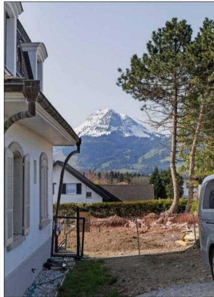
Sur la parcelle de Jéricho concernée par cette bataille juridique, les nombreux arbres ont déjà succombé aux tronçonneuses. CHLOE LAMBERT

Aquiesce-t-elle l'article 125 alors? A rien d'autre que d'éviter une utilisation déraisonnable des possibilités de construire, répondent les juges. Qui reprochent à la CAU une même incompréhension de la clause d'esthétique: «Elle n'interdit pas des réalisations architecturales et urbanistiques, le cas échéant, médiocres. Elle se limite aux seuls cas dans lesquels l'impact du projet dépasse clairement ce que l'intégrité du site peut supporter.»